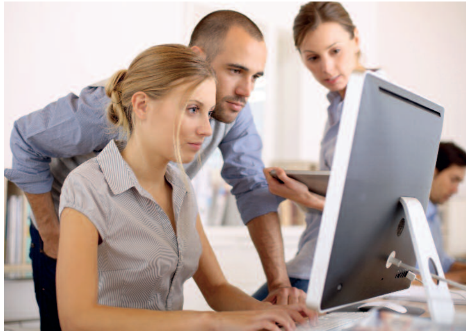
Rohde &amp; Schwarz setzt auf ein Add-on für optimierte Kommunikation mit seinen Dienstleistern

Seit mehr als 80 Jahren steht das Münchner Unternehmen Rohde & Schwarz auf sämtlichen Feldern der drahtlosen Kommunikation für Qualität, Präzision und Innovation in den Bereichen Messtechnik, Rundfunk, sichere Kommunikation sowie Funküberwachungs- und Ortungstechnik. Heute ist der Elektronikkonzern mit seinen Dienstleistungen und einem engmaschigen Servicenetz in über 70 Ländern der Welt präsent.